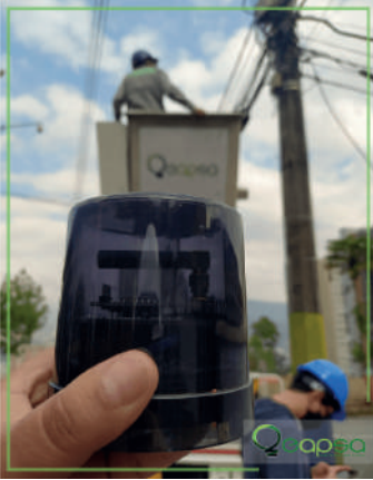
Implementación del Sistema de Telegestión del Alumbrado Público en Sabaneta.