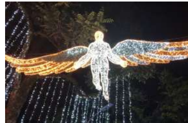
Diseño y montaje de alumbrado navideño.