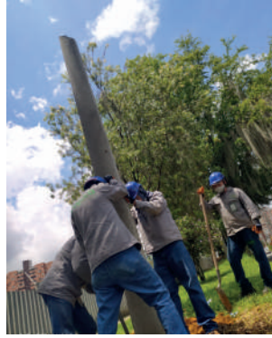
Realización de mantenimiento, expansión y modernización de alumbrado público en Sabaneta..