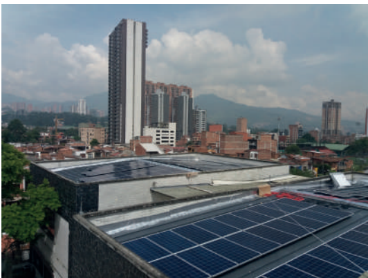
Aprovechamiento de la energía solar para el ahorro energético en el Hospital Venancio Díaz Díaz y CAITES. Sabaneta.